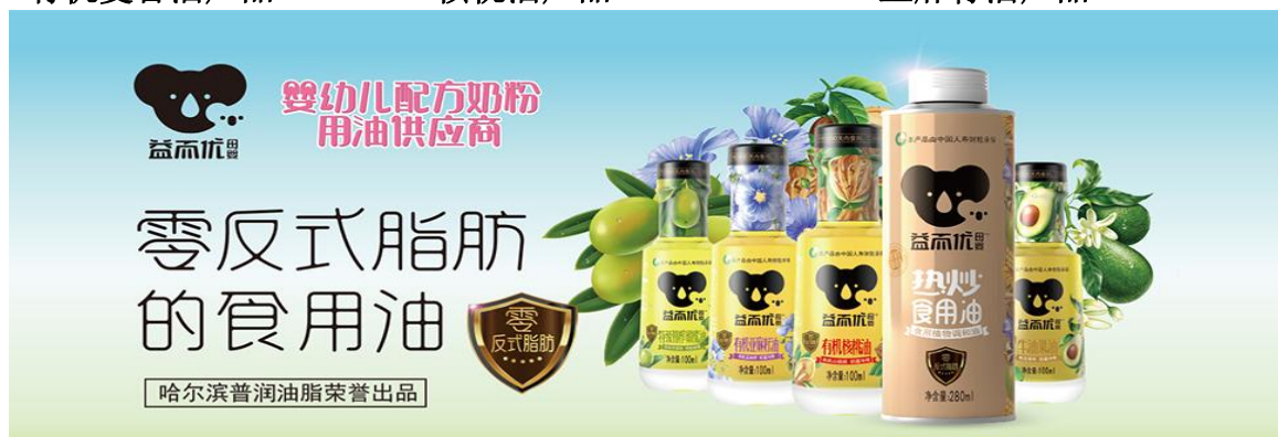
益而优品牌食用油产品