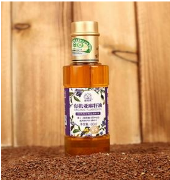
有机亚麻籽油产品